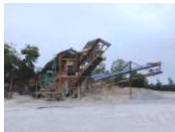
โรงแต่งแร่ของโครงการ