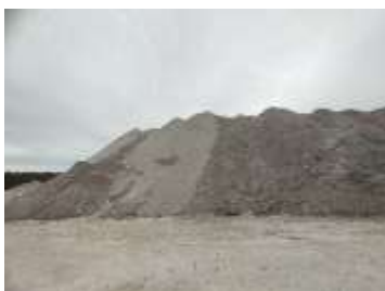
ลานเก็บกองแร่