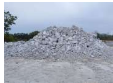
กองเปลือกหิน/ดิน