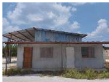
บ้านพักพนักงาน