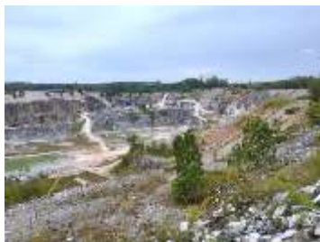
พื้นที่หน้าเหมือง