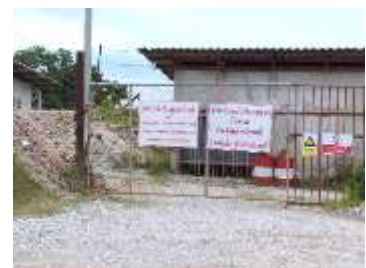
อาคารเก็บวัสดุระเบิด